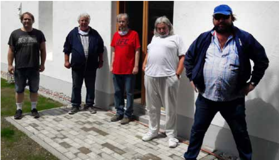
Die neuen Bewohner des Wohnprojektes

Im Wohnprojekt Tiroler Hof des Münchner Projektvereins wird chronisch psychisch kranken Menschen ein Zuhause angeboten, indem sie lebenspraktische und soziale Fertigkeiten (wieder-)erwerben und eine größtmögliche subjektive Lebenszufriedenheit für sich erreichen können.