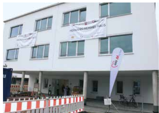
Das fast fertige Hermann-Memmel-Haus

Das Hermann-Memmel-Haus wird vielen Menschen die Chance geben, eine sinnvolle Tätigkeit auszuüben in den Bereichen IT-Dienstleistungen, Montagearbeiten, Verwaltungsarbeiten, Hauswirtschaft (u.a. Wäscheservice, Reinigung) und Catering.