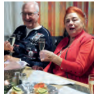
Europa wählt – wir wählen mit!