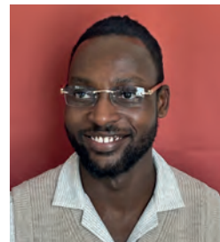
Stanley Mike Bundesfreiwilligendienst