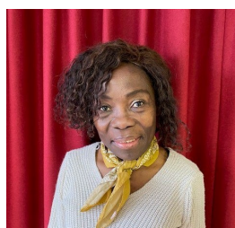
Begleitung mit guter Laune